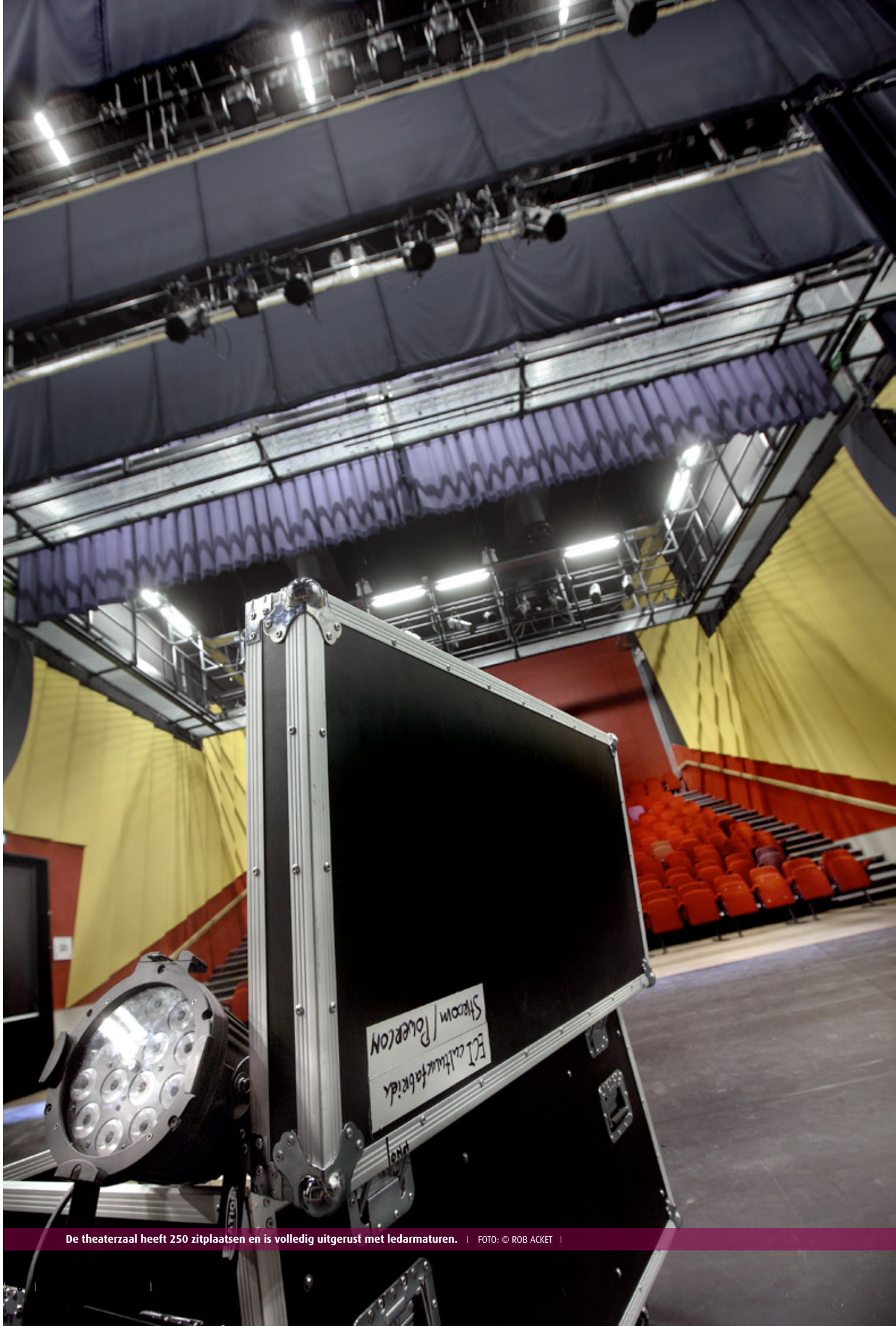
De theaterzaal heeft 250 zitplaatsen en is volledig uitgerust met ledarmaturen.