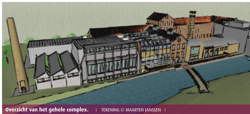
Overzicht van het gehele complex. | TEKENING © MAARTEN JANSSEN |

Licht: LightCo Geluid: Live Music Geluid Sound Projects: De Fabriek, Easy Touch Trussen en riggingmateriaal: LightCo Stoffering en theaterdoeken: Ron de Groot Tribunes en stoelen: Auditoria Services Trekkenwandinstallatie: Stakebrand TWS Bruggen: BKC Elektrische installaties en klimaatbeheersing: Homij